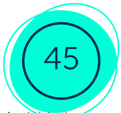
Actividades en total

El equipo participó en 13 actividades de conservación, incluyendo la limpieza de residuos sólidos en cenotes, redignificaciones en Palo ancestral y Papalote, y la revisión/prospección de diversas áreas como Garritas, Gotas de fuego, Laska, Guamas, Dama blanca, Escondrijo, Yorogana, entre otras. También se realizó buceo en Xtun y rapel en pilotes, con un total de 74 participantes y 236.5 kg de residuos retirados del delicado ecosistema subterráneo.